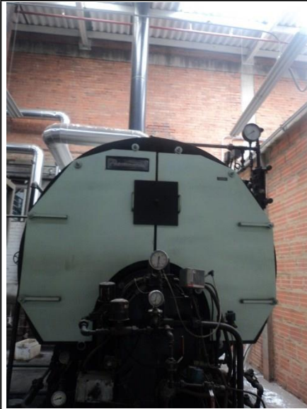
FOTOGRAFÍA 6. CALDERA 150 BHP