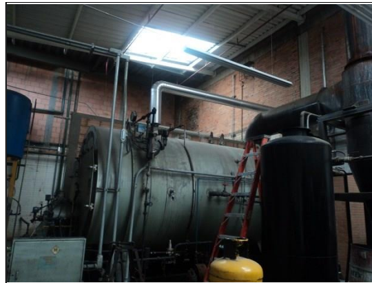
FOTOGRAFÍA 4. CALDERA 200 BHP