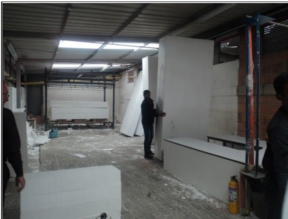
FOTOGRAFÍA 3. ÁREA DE CORTE