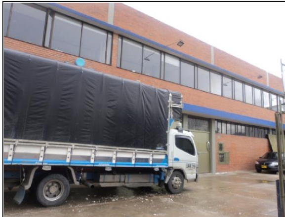
FOTOGRAFÍA 2. FACHADA DEL PREDIO