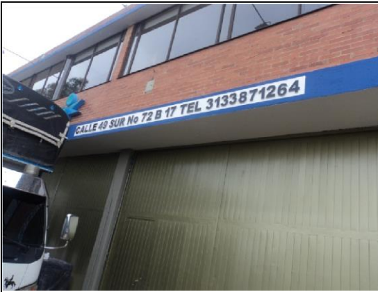
FOTOGRAFÍA 1. PLACA DEL PREDIO