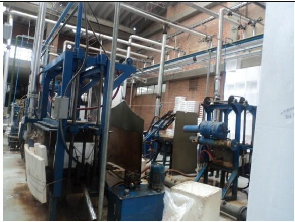
FOTOGRAFÍA 7. ÁREA DE MOLDEO