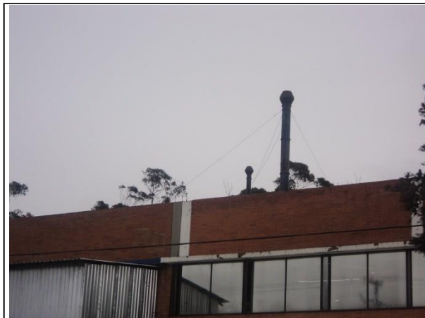
FOTOGRAFÍA 9. DUCTOS DE CALDERAS