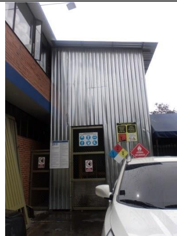
FOTOGRAFÍA 8. ALMACENAMIENTO COMBUSTIBLE